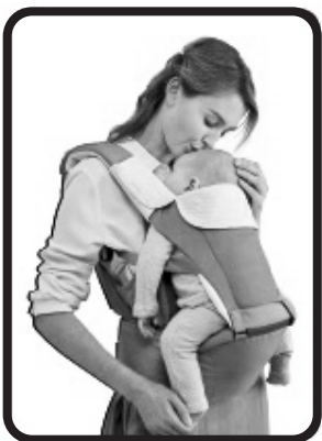
mirando hacia adentro