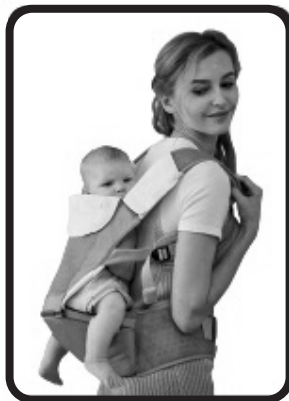
Llevar a la espalda