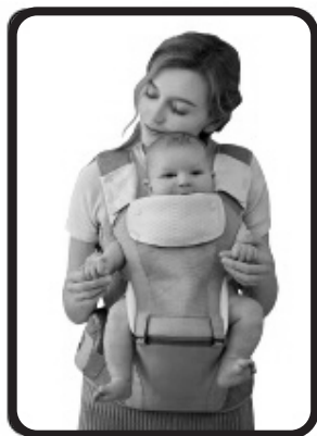
Mirando hacia afuera